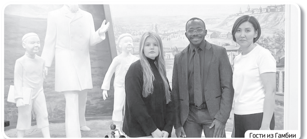
Гости из Гамбии

— Больше всего туристов из России. За прошлый год в гости побывали жители Москвы, Челябинска, Якутии (Карталы), Екатеринбург, Пермь, Татарстана