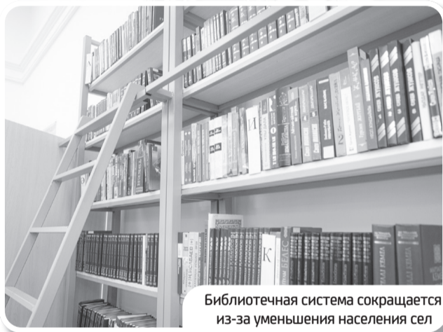
Библиотечная система сокращается из-за уменьшения населения сел