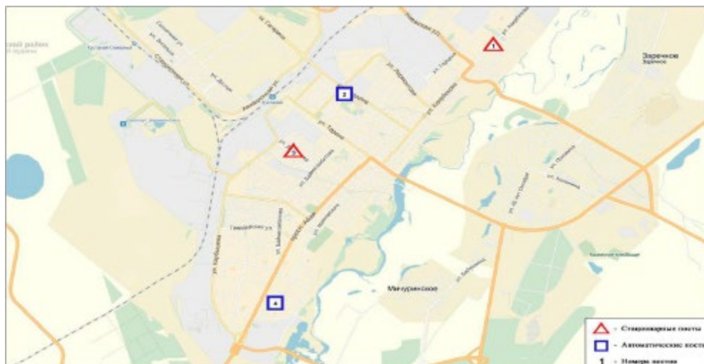
Рис.3 Схема расположения стационарной сети наблюдения за загрязнением атмосферного воздуха города Костанай

Общая оценка загрязнения атмосферы. По данным стационарной сети наблюдений, атмосферного воздуха оценивался как высокий, определялся значениями ИЗА= 8 (высокий), СИ= 3,1 (повышенный) по диоксиду азота и НП = 4% (повышенный) по озону в районе ПНЗ №2(ул. Бородина, район дома № 142).