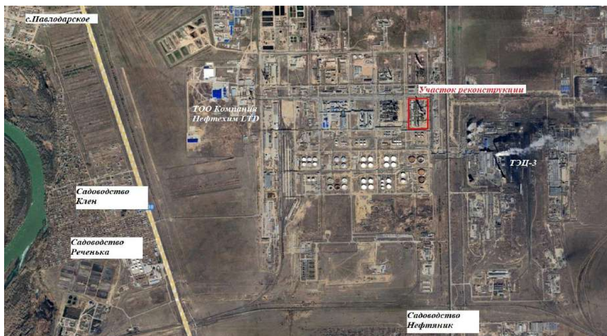
Рис.1 Обзорная карта расположения участка строительства

На расстоянии 2,76 км с западной стороны проходит автодорога Павлодар-Омск, а за ней на расстоянии более 3 км размещаются территории садоводств «Реченька» и «Клен». С южной стороны на расстоянии около 1,83 км проложены железнодорожные пути, за которыми на расстоянии 2 км находится садоводство «Нефтяник».