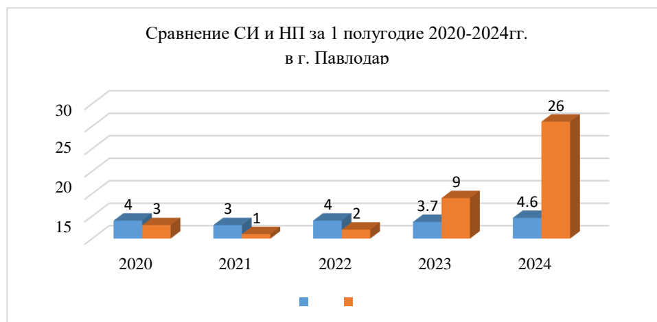
Рис.5. Динамика уровня загрязнения атмосферного воздуха

За последние пять лет уровень загрязнения атмосферного воздуха в 1 полугодии изменялся следующим образом: