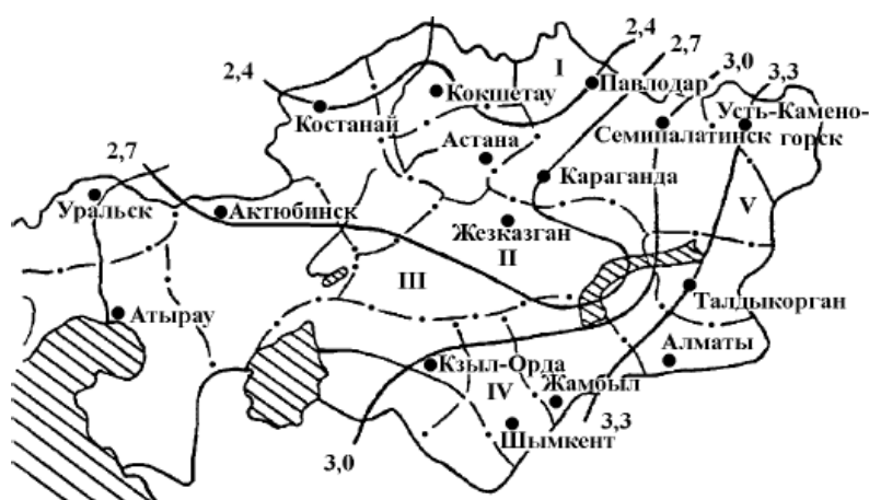
Рис. 3. Районирование территории Республики Казахстан с точки зрения благоприятности районов для самоочищения атмосферы.

Казахстанским научно-исследовательским гидрометеорологическим институтом проведено районирование территории Республики Казахстан, с точки зрения благоприятности отдельных ее районов для самоочищения атмосферы от вредных выбросов в зависимости от метеоусловий. В соответствии с этим районированием, территория поделена на пять зон (рисунок 3).