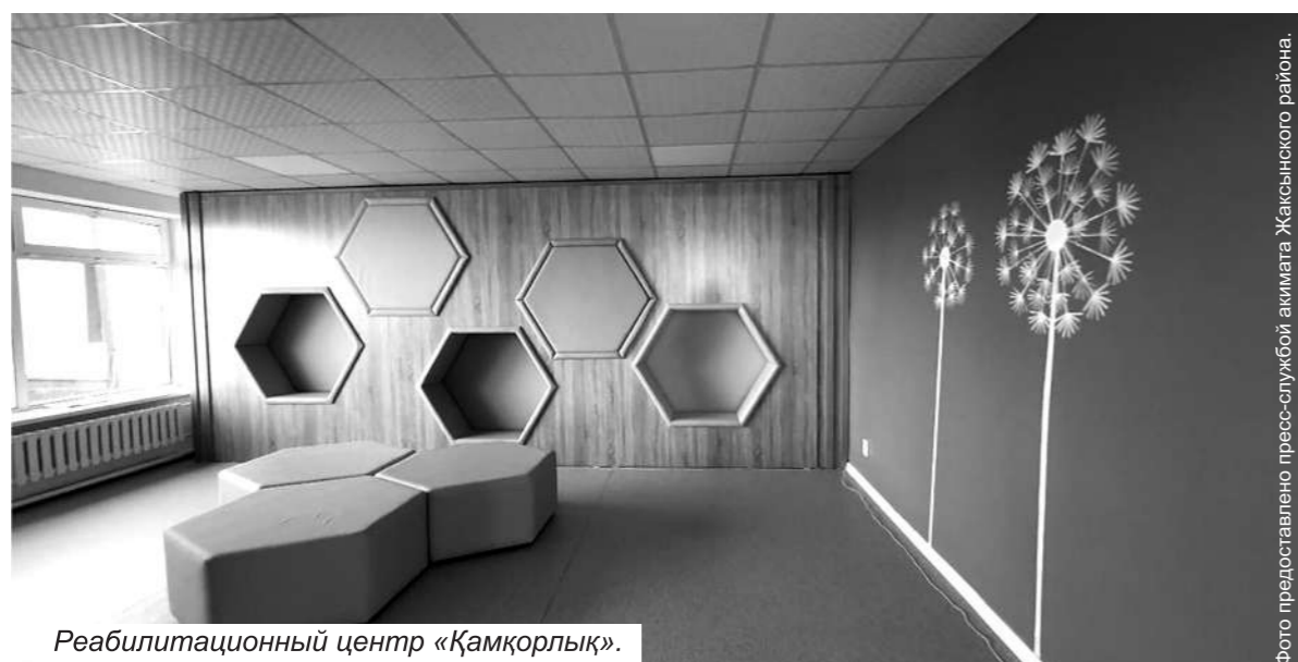
Реабилитационный центр «Қамқорлық».

В Ишимском сельском округе Жаксынского района успешно завершен ремонт стадиона, ставшего настоящим центром притяжения для любителей спорта.