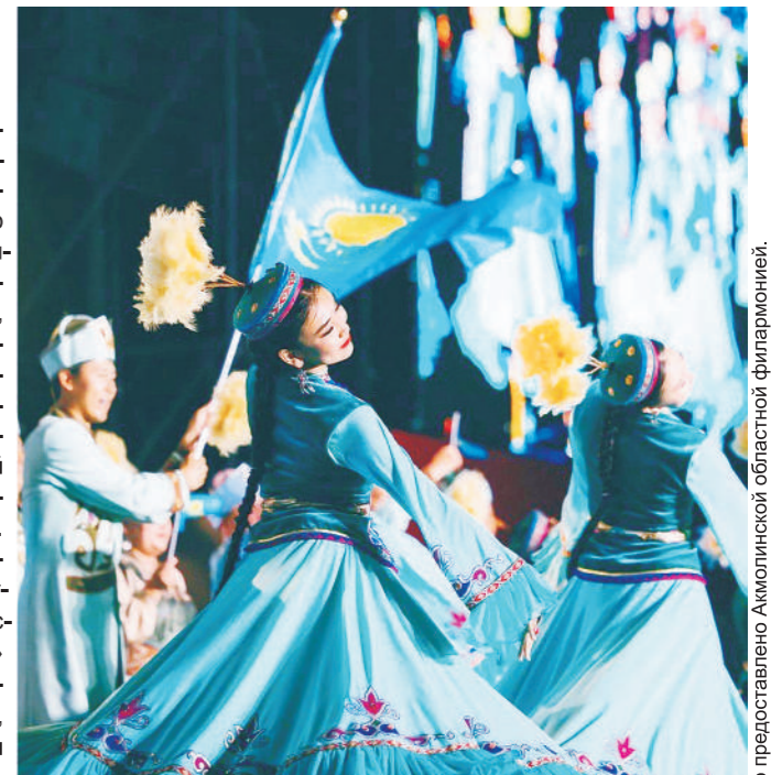
Артисты филармонии на фестивале «Чхонан» в Южной Корее.

– Каждый творческий коллектив филармонии представит в рамках открытия сезона свою программу. Однако деятельность коллектива не ограничивается только концертами. Артисты филармонии приняли участие в торжественной церемонии открытия V Всемирных игр ковчегников. На фестивале «Чхонан» в Южной Корее фольклорный ансамбль «Айнакөл» и ансамбль танца «Гэкку» представили бога-