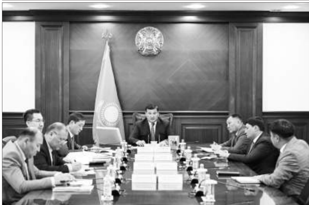
Глава региона выслушал отчеты по выполнению поручений. Как известно, по итогам рабочей поездки в регион, вице-премьер РК Тамара Дуйсенова провела совещание. Акимам города и районов было поручено привести в по-