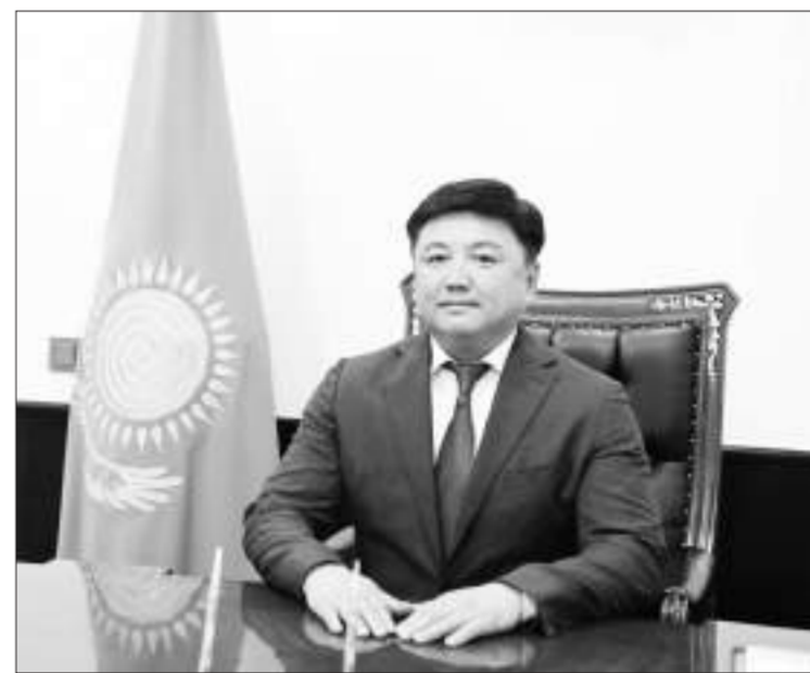
витию инженерно-коммуникационной инфраструктуры, — сказал глава региона. — Положительно решена проблема обеспечения жителей многоквартирных домов горячей водой.