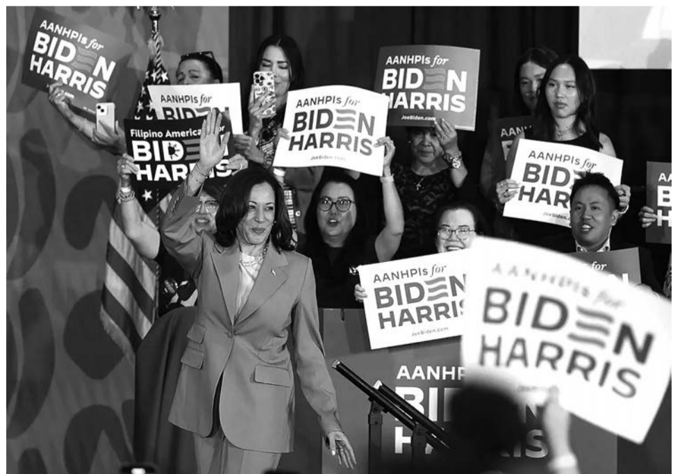
Камала Харрис во время предвыборного митинга в Лас-Вегасе, штат Невада, 09 июля 2024 года.