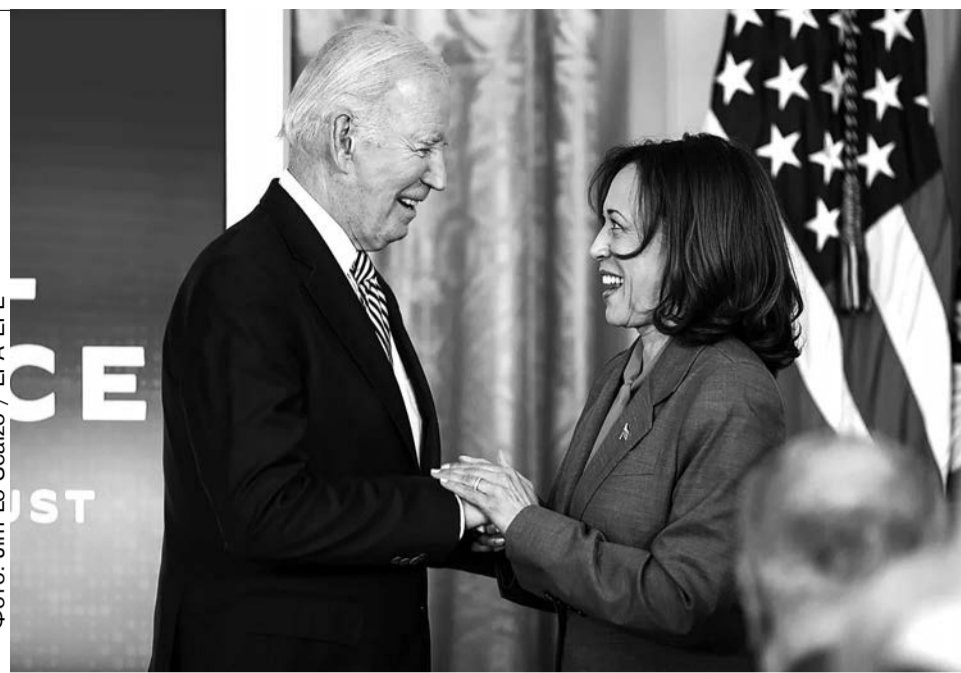
Президент США Джо Байден и вице-президент Камала Харрис в Белом доме в Вашингтоне, США, 30 октября 2023 года.

«Политика должна быть актуальной, — заявляла Харрис в интервью The New York