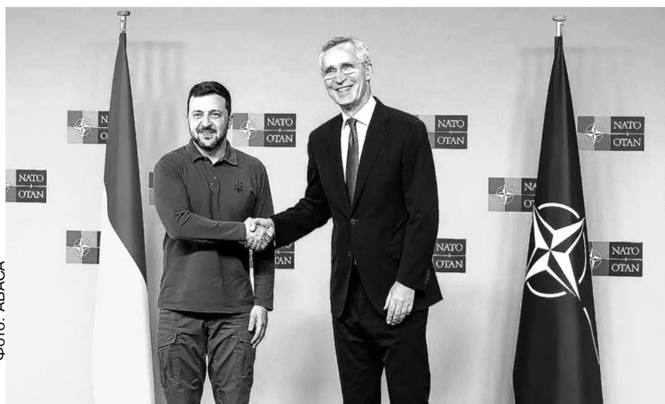
Генеральный секретарь НАТО Йенс Столтенберг с президентом Украины Владимиром Зеленским.

Да, у этой границы, возможно, стояло недостаточно войск. Но у Украины тоже ограничена людская сила, а граница длинная, невозможно концентрировать войска вдоль всей границы. При этом украинцы достаточно быстро перебросили силы, когда это потребовалось.