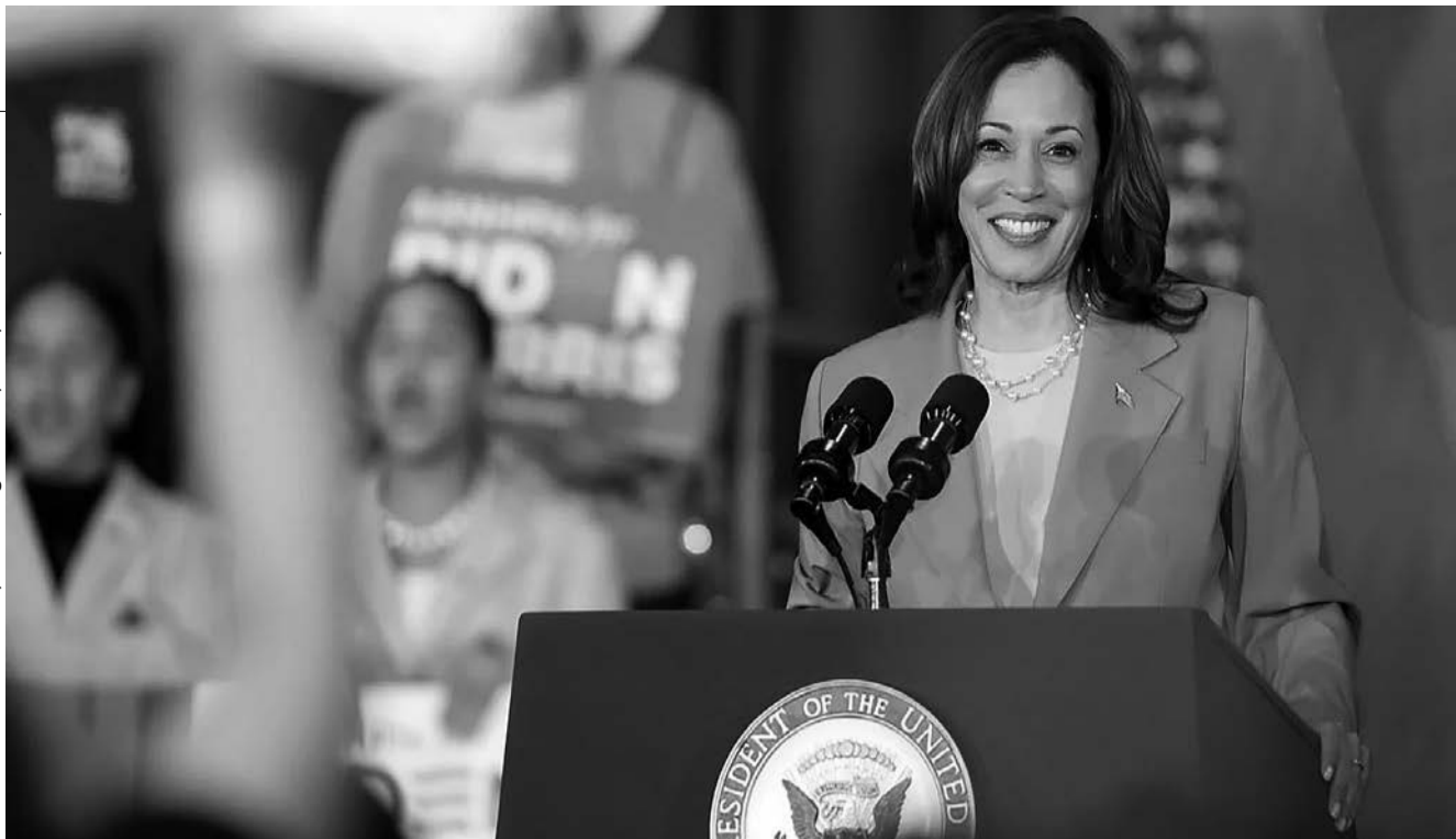
Вице-президент Камала Харрис на предвыборном митинге в Лас-Вегасе, 9 июля 2024 года