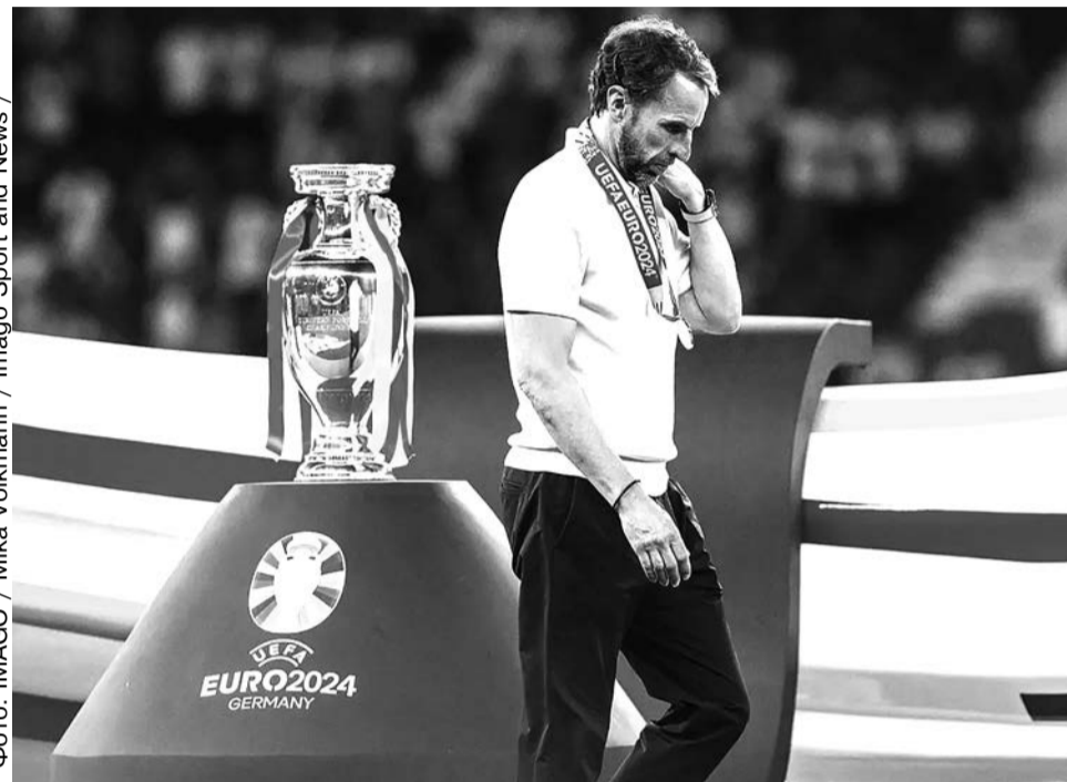
Главный тренер сборной Англии Гарет Саутгейт после церемонии награждения на финальном матче Евро-2024 Испания — Англия

Хорошо еще, что в целом обошлось без явных попыток все происходящее на поле воспринимать через призму политической