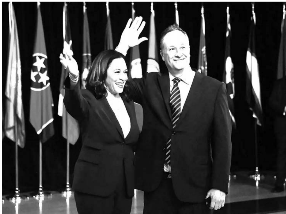
Кандидат в вице-президенты от Демократической партии, сенатор США Камала Харрис и ее муж Дуглас Эмхофф, 12 августа 2020 года.

« В НОЯБРЕ 2010 ГОДА ХАРРИС ОДЕРЖАЛА ПОБЕДУ НА ВЫБОРАХ ГЕНЕРАЛЬНОГО ПРОКУРОРА КАЛИФОРНИИ, СТАВ ПЕРВОЙ ТЕМНОКОЖЕЙ, ПЕРВЫМ ЧЕЛОВЕКОМ ЮЖНОАЗИАТСКОГО ПРОИСХОЖДЕНИЯ И ПЕРВОЙ ЖЕНЩИНОЙ НА ЭТОМ ПОСТУ