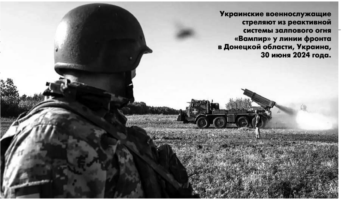
Украинские военнослужащие стреляют из реактивной системы залпового огня «Вампир» у линии фронта в Донецкой области, Украина, 30 июня 2024 года.